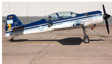
Figura 4 – Aeronave Su-29 no solo.

Em 22 de setembro de 1997, os dois últimos aviões SU-29AR foram entregues ao esquadrão. Em 10 de agosto de 1999, a esquadrilha "Cruz del Sur", realizou pela primeira vez uma apresentação com cinco aviões durante o desfile da Força Aérea em El Palomar e em novembro daquele ano, a equipe fez sua primeira demonstração no exterior, se apresentando no Uruguai.