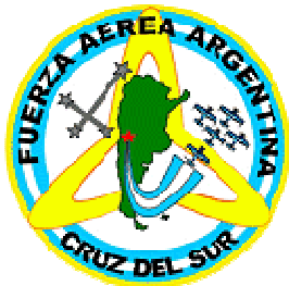
Figura 1 – Brasão do Esquadrão de Acrobacia da Força Aérea Argentina Cruz Del Sur.

As aeronaves do esquadrão Cruz del Sur foram produzidas especialmente para a Força Aérea Argentina pelo fabricante Sukhoi e são pintadas com as cores nacionais azul e branco.