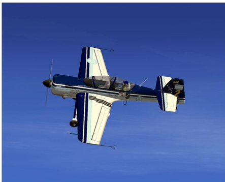
Figura 7 – Animação gráfica do Su-29.

A aeronave Su-29 é normalmente utilizada para o treinamento inicial de pilotos acrobáticos, treinamento básico de pilotagem e para participação de pilotos em campeonatos de acrobacia e shows aéreos, bem como para voos de treinamento de pilotos civis e militares.