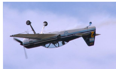
Figura 5 – Voo de dorso.