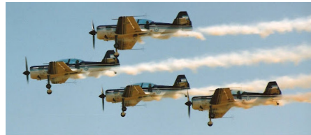
Figura 3 – Formação com 4 aeronaves.

A primeira demonstração com quatro aeronaves foi em 7 de julho no tradicional desfile do Dia da Força Aérea Argentina na cidade de Moreno.