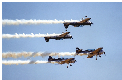
Figura 2 – Cruz del Sur com 4 aeronaves em espelho.

A primeira demonstração pública foi no Aeroporto de Buenos Aires em 10 de abril de 1951, quando três Gloster Meteors realizaram manobras acrobáticas em formação fechada.