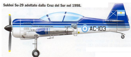
Figura 9 – Vista Lateral Su-29.