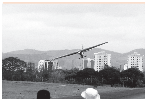
Fotografia 1: Vôo da aeronave Ícaro durante a competição

mento da competição, que estipula a utilização de um motor-padrão para todas as equipes e limita o comprimento de pista em 61 metros (m) para a decolagem. As curvas de tração disponível e requerida da aeronave foram traçadas tendo como base a aplicação de conceitos aerodinâmicos e de propulsão da aeronave em condições de voo reto e nivelado para atmosfera-padrão no nível do mar. Nessas condições, a teoria contempla que a força de sustentação deve ser igual ao peso máximo da aeronave, e a força de arrasto, igual à tração requerida pela aeronave. Nessas curvas, é possível observar que a aeronave é capaz de voar em velocidades que podem variar entre 9 e 26 metros por segundo (m/s). Com relação ao desempenho de decolagem, ele é um fator limitante para o projeto, pois, com uma de pista de 61 m, a máxima carga possível para o voo da aeronave fica restrita a melhorias aerodinâmicas na escolha do perfil e na redução da força de arrasto. No Gráfico 2, pode-se observar que a massa total de decolagem da aeronave é da ordem de 14 quilogramas (kg). Vale ressaltar que, nesse montante, considera-se a massa da aeronave vazia mais a massa transportada. A Fotografia 1 mostra a aeronave Ícaro em um dos vôos realizados durante a competição.